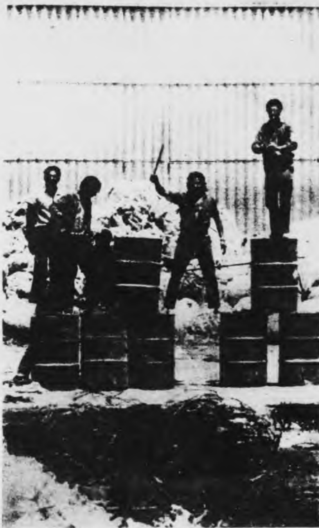
Se tomó BTB (Pompeya)