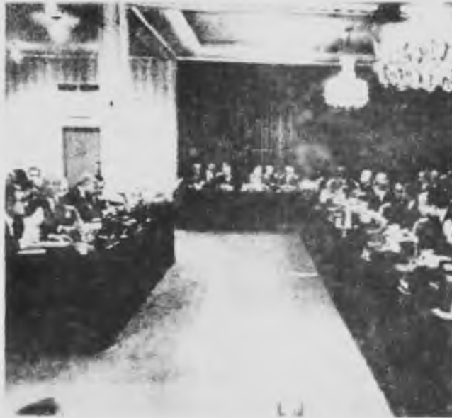
Cafiero reclamó el visto bueno del FMI para la política económica de nuestro país.

El Ministro dice que con esos créditos logró evitar una negociación de fondo con el FMI que lo obligaría a adoptar una estricta política económica de desocupación, restricción del mercado interno con congelamiento salarial